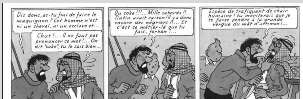
Hergé, Coke en stock, 1958.